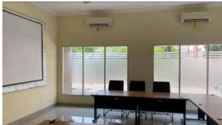
Gambar 5. Ruang rapat