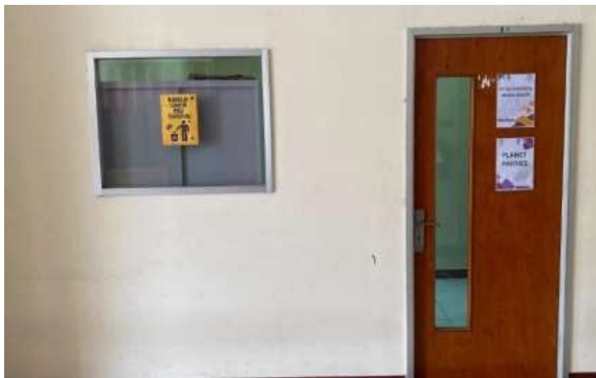
Tabel 2. Detail Fasilitas Ruang Tenant Inkubator Bisnis