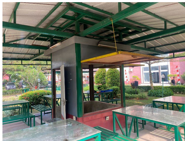
Gambar 8. Kios penjualan