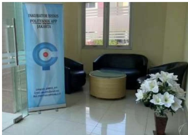
Gambar 6. Ruang tamu