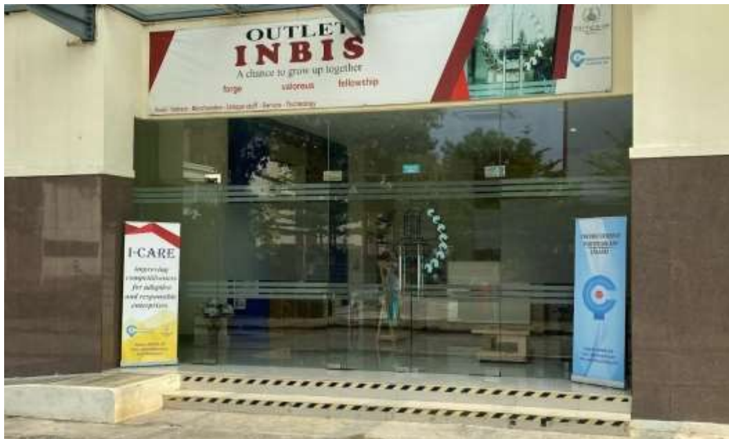
Gambar 2. Gedung INBIS

Gambar 2 adalah gambar gedung Inkubator Bisnis Politeknik APP Jakarta dan berbagai ruangan, diantaranya ruangan pengelola Inbizz, ruang pertemuan, ruang display produk, dan ruang tenant. Semua fasilitas dan layanan yang diberikan oleh Inkubator Bisnis Politeknik APP Jakarta bersifat terbuka untuk digunakan oleh tenant atau pihak lain atas dasar mekanisme perizinan yang telah ditetapkan.