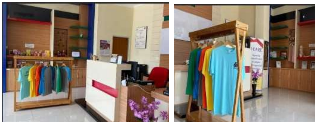
Gambar 3. Ruang display