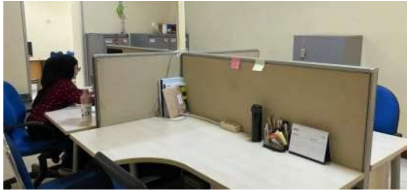
Gambar 7. Ruangang Pengelola