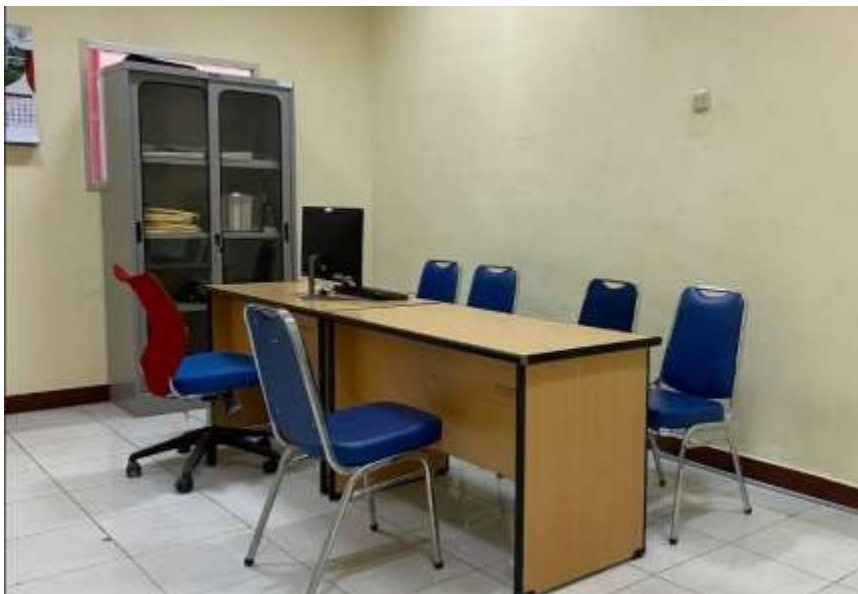
Gambar 4. Ruang tenant