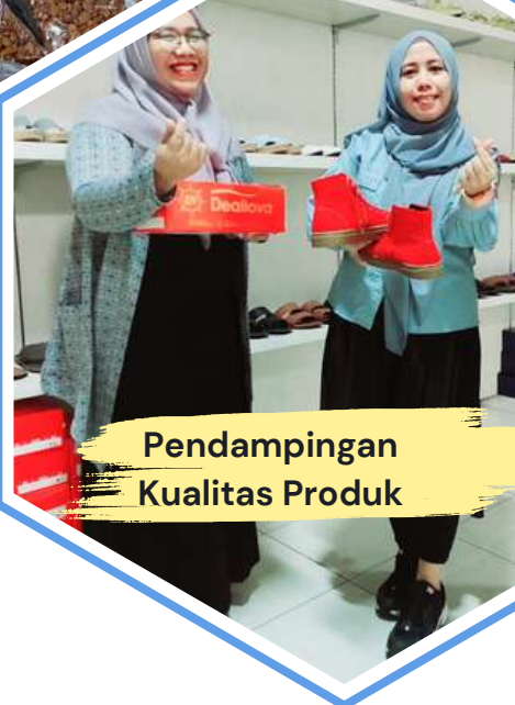
Pendampingan Kualitas Produk

Kegiatan Pendampingan, Pelatihan dan Fasilitasi Pendamping dan KUMKM