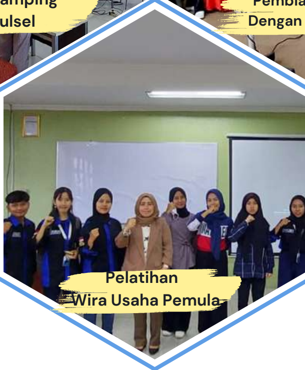
Pelatihan Wira Usaha Pemula