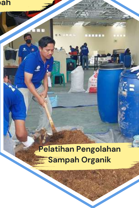
Pelatihan Pengolahan Sampah Organik

Kegiatan Pendampingan, Pelatihan dan Fasilitas Pendamping dan KUMKM