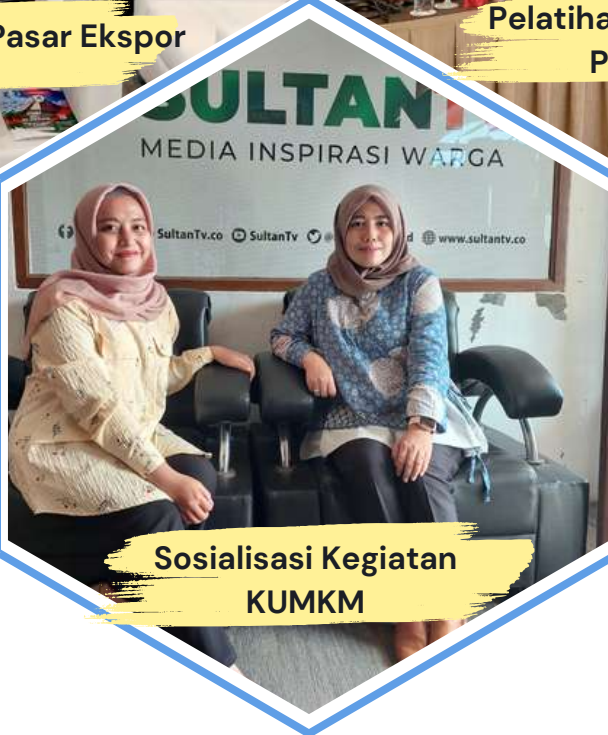
Sosialisasi Kegiatan KUMKM