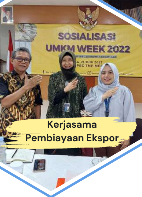
Kerjasama Pembiayaan Ekspor