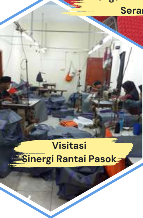
Visitasi Sinergi Rantai Pasok