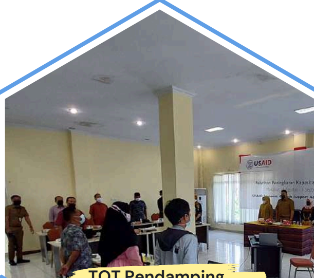
TOT Pendamping PLUT Sulsel