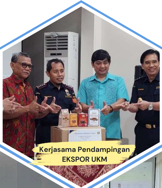
Kerjasama Pendampingan EKSPOR UKM