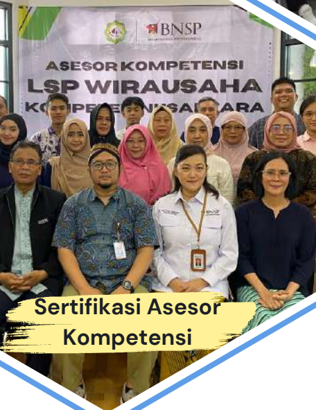
Sertifikasi Asesor Kompetensi