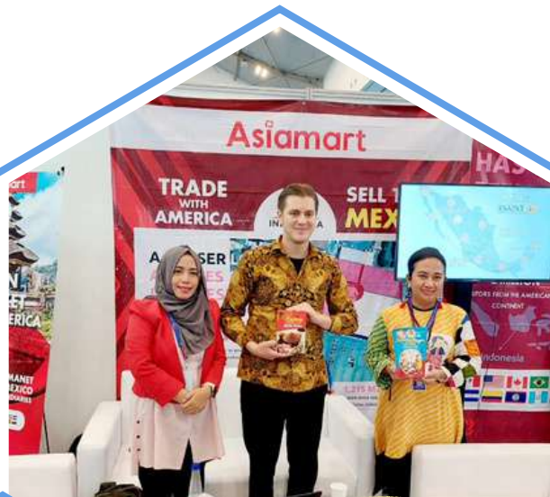
Kerjasama Pasar Ekspor