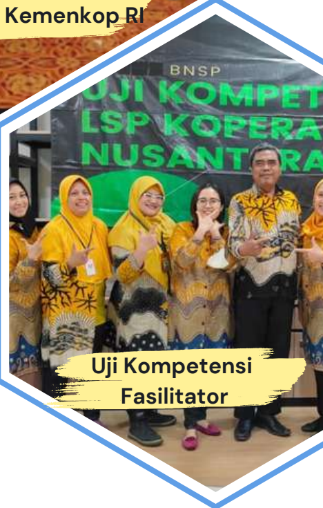
Uji Kompetensi Fasilitator

Kegiatan Pendampingan, Pelatihan dan Fasilitasi Pendamping dan KUMKM