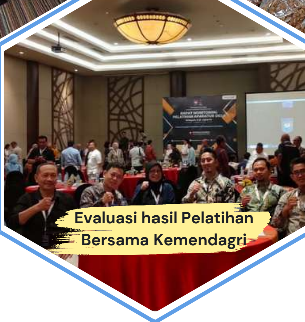
Evaluasi hasil Pelatihan Bersama Kemendagri