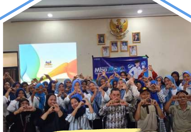
PKU-Pelatihan Nasabah PT. PNM Jabar