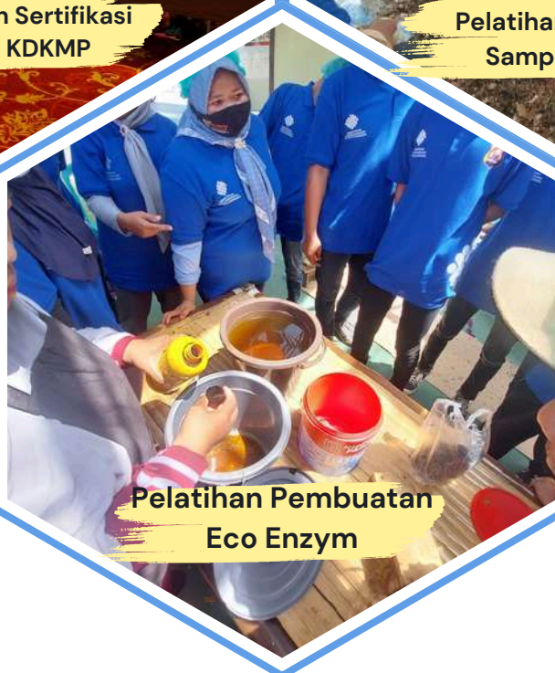
Pelatihan Pembuatan Eco Enzym