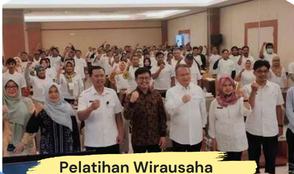
Pelatihan Wirausaha Pemula di Disperindag