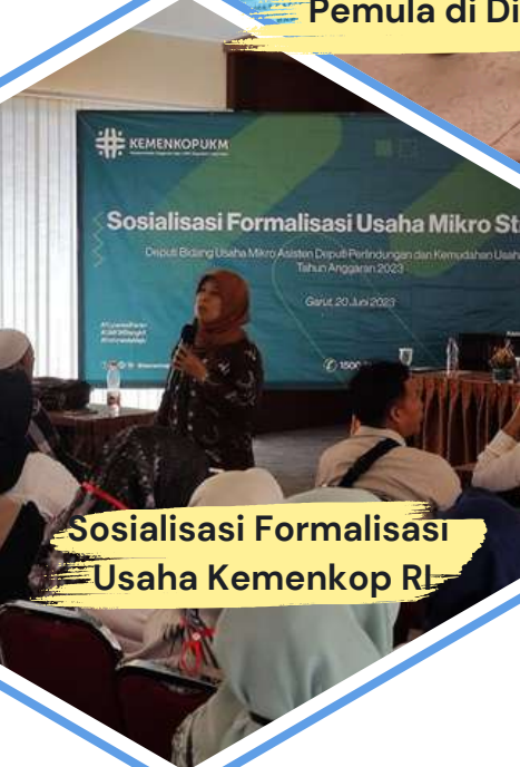
Sosialisasi Formalisasi Usaha Kemenkop RI