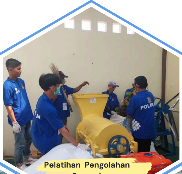
Pelatihan Pengolahan Sampah