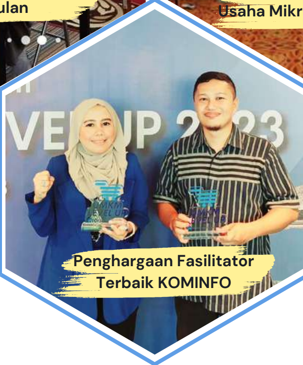
Penghargaan Fasilitator Terbaik KOMINFO