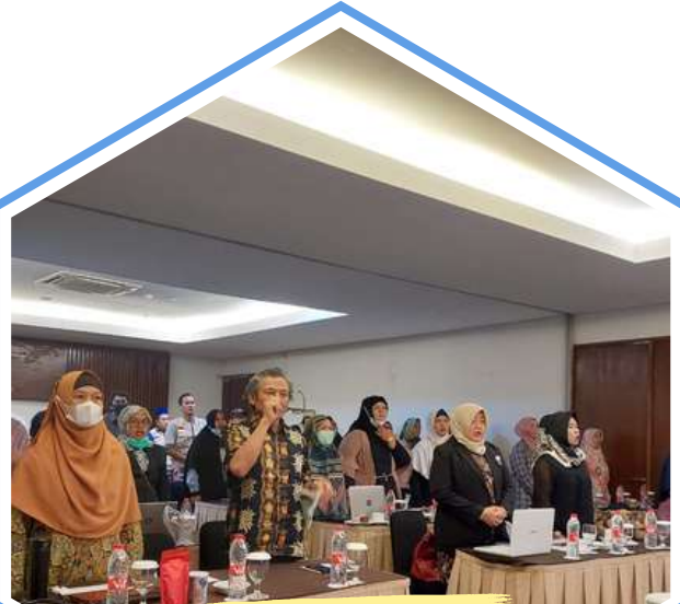
Pelatihan Keamanan Pangan