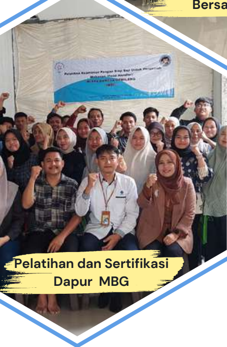
Pelatihan dan Sertifikasi Dapur MBG