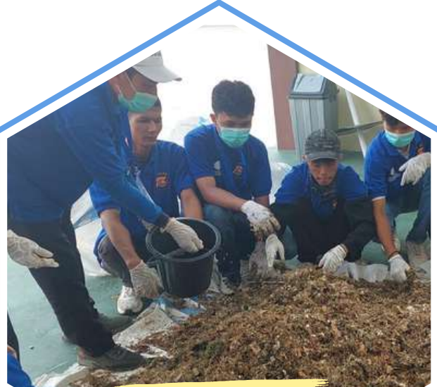
Pelatihan Pengolahan Sampah Organik