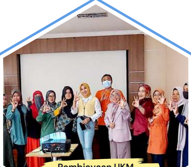
Pembiayaan UKM Dengan Perbankan