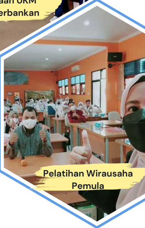
Pelatihan Wirausaha Pemula

Kegiatan Pendampingan, Pelatihan dan Fasilitasi Pendamping dan KUMKM