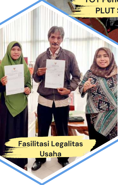
Fasilitasi Legalitas Usaha