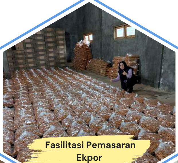
Fasilitasi Pemasaran Ekpor