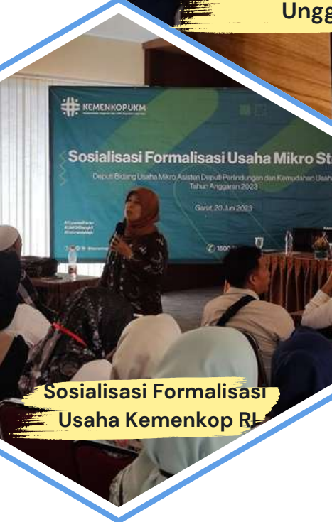
Sosialisasi Formalisasi Usaha Kemenkop RI