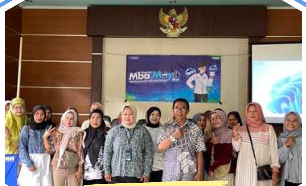
PKU-Pelatihan Nasabah PT. PNM Jabar