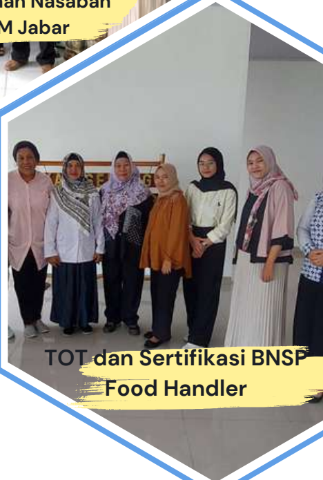
TOT dan Sertifikasi BNSP Food Handler

Kegiatan Pendampingan, Pelatihan dan Fasilitasi Pendamping dan KUMKM