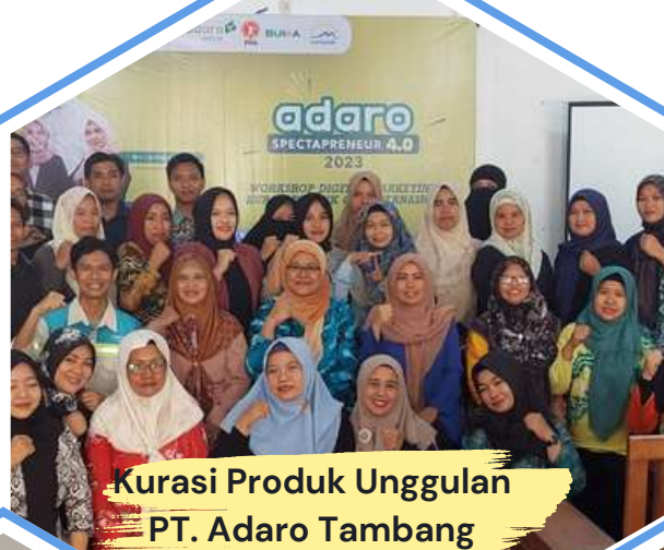
Kurasi Produk Unggulan PT. Adaro Tambang