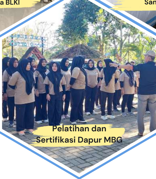
Pelatihan dan Sertifikasi Dapur MBG