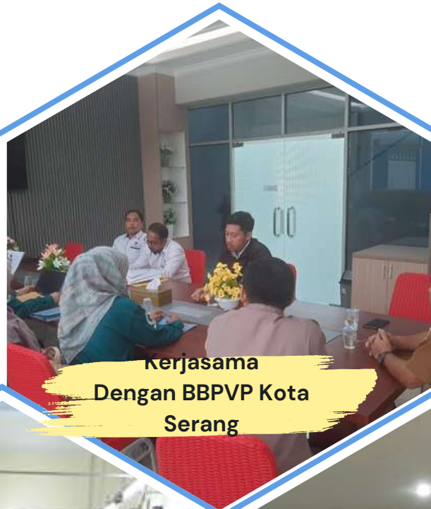
Kerjasama Dengan BBPVP Kota Serang