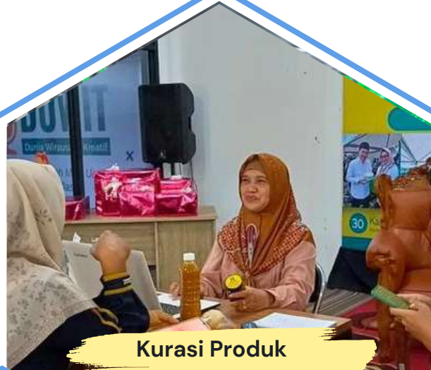
Kurasi Produk Unggulan