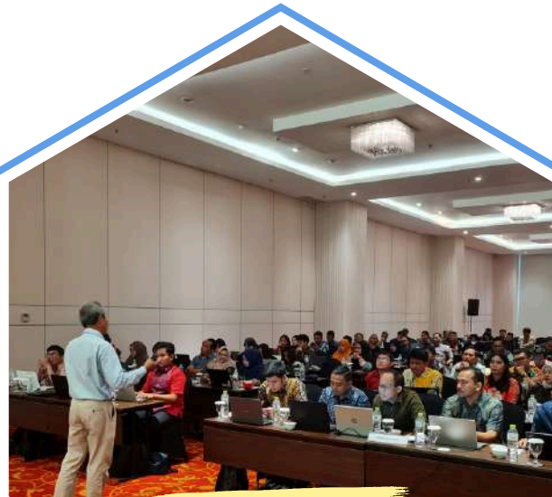
Pelatihan dan Sertifikasi Pengurus KDKMP