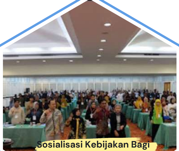
Sosialisasi Kebijakan Bagi Usaha Mikro. Kemenkop RI