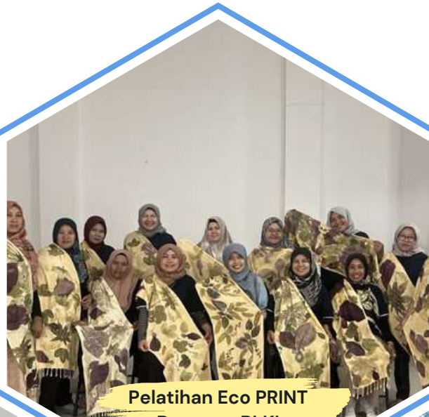
Pelatihan Eco PRINT Bersama BLKI