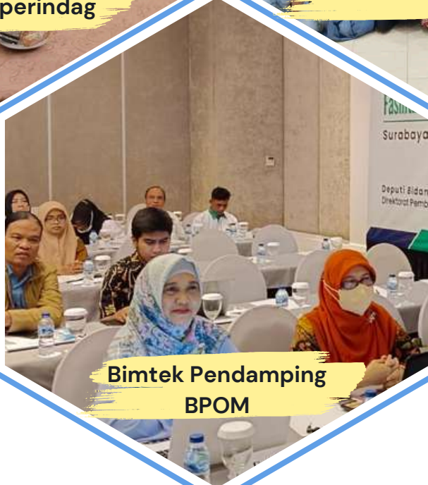
Bimtek Pendamping BPOM