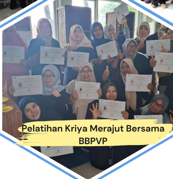
Pelatihan Kriya Merajut Bersama BBPVP