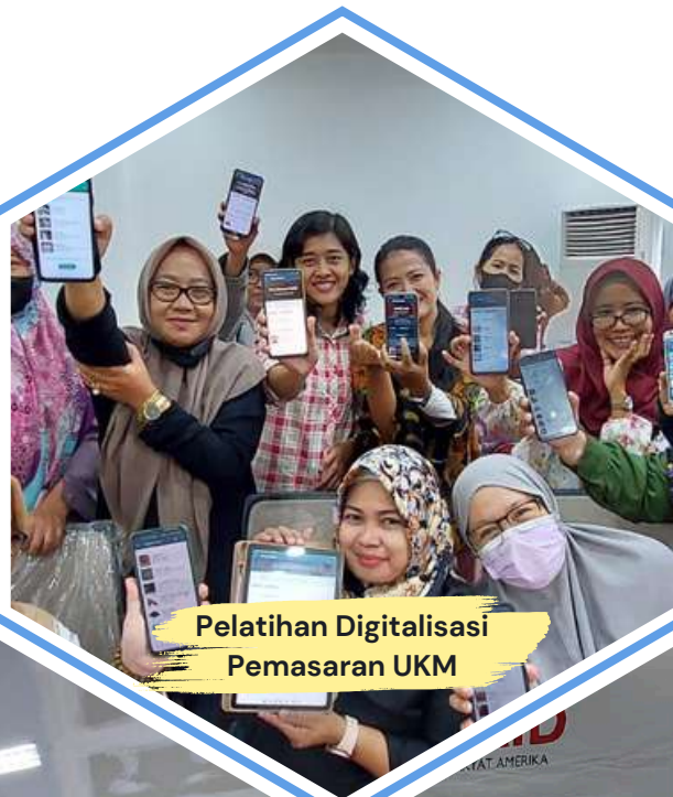
Pelatihan Digitalisasi Pemasaran UKM