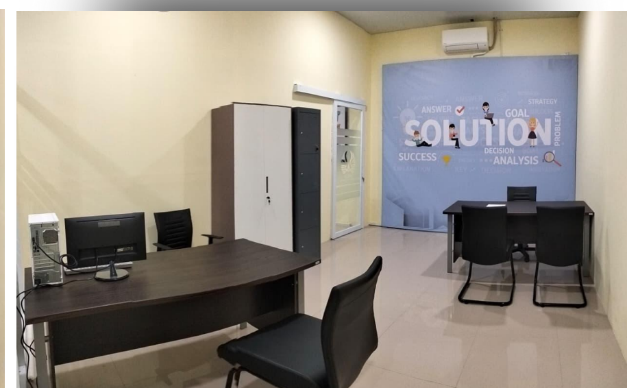
Ruang Tenant 4