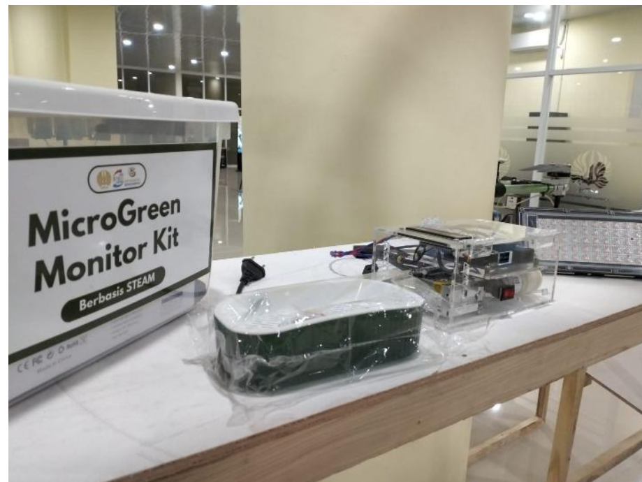
MicroGreen Monitor Kit