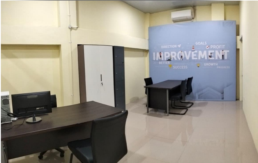
Ruang Tenant 1