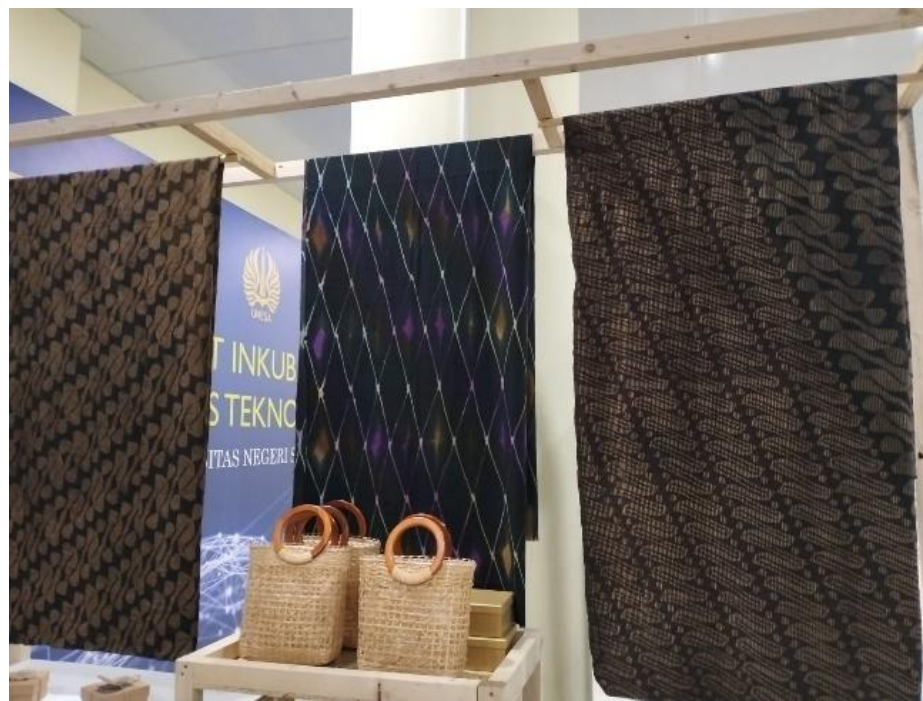
Kain Tenun Serat Nanas Karonsih