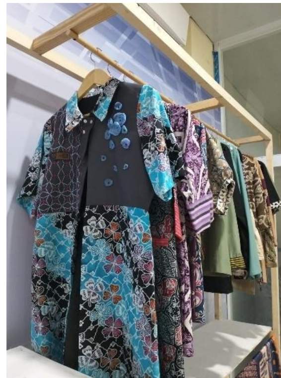
Batik Ready to Wear