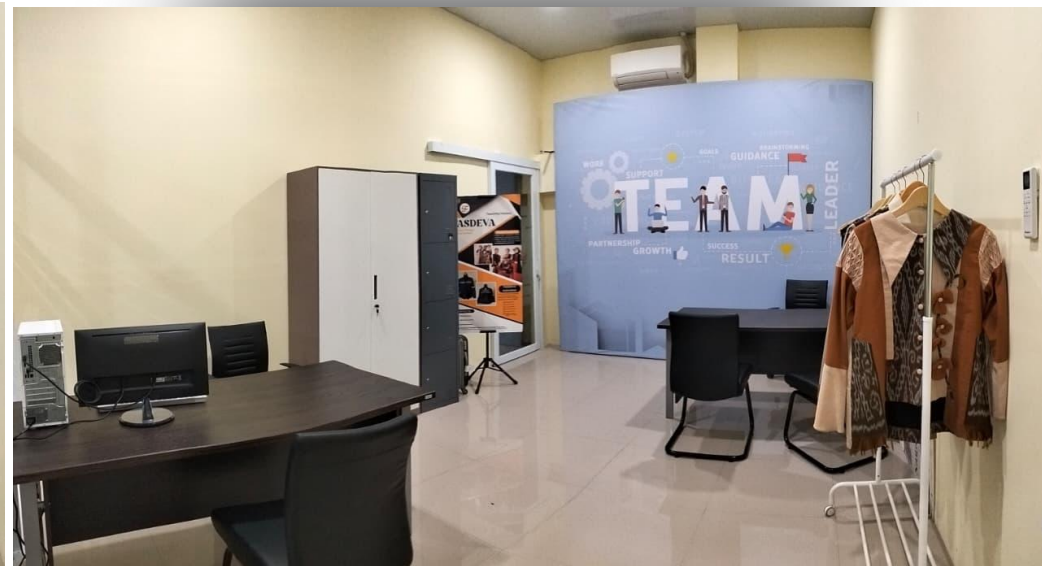
Ruang Tenant 2