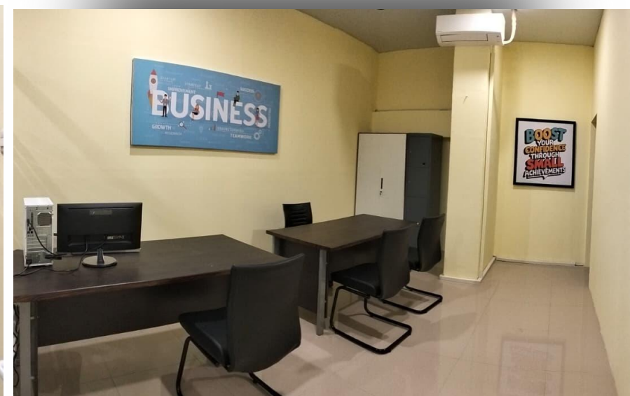
Ruang Tenant 3