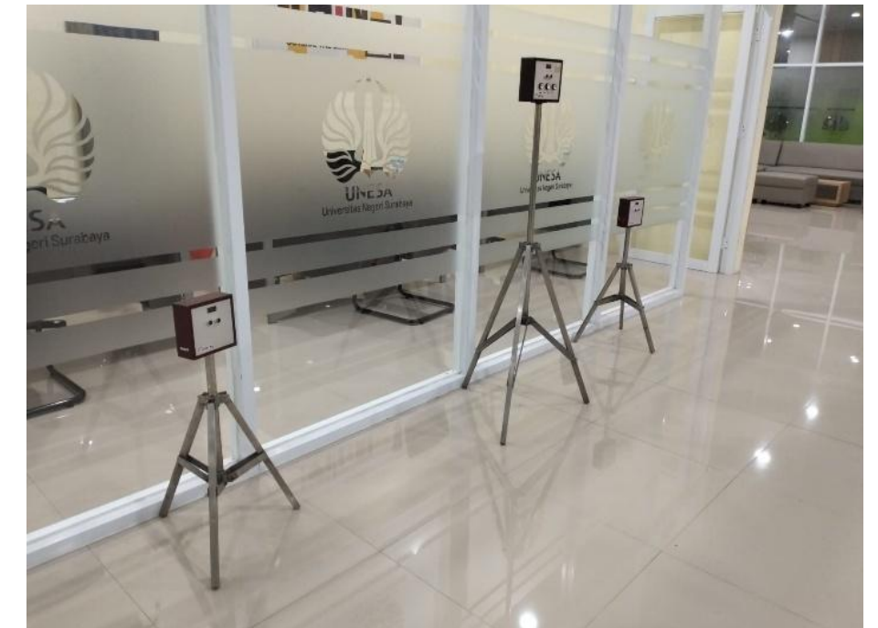
ALACRITY Agility Test